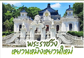
พระราชวัง เฉวอนเหมิงเฉวอนฮีเหม่