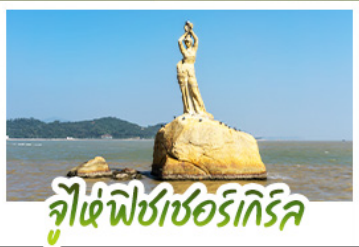
จุไห่พิชเชอร์รี่เกิลริค