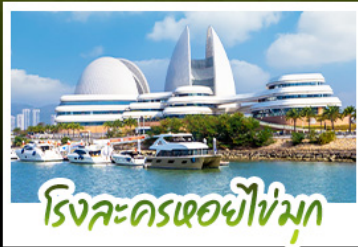
โรงละครเธียโทรซิมูค