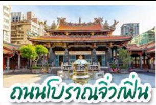
ถนหนปิราณจิวเฟิ่น

ทะเลสาบสุริยันจันทรา - ล่องเรือชมวิว - จิวเฟิ่น ลือเฟิ่น - TAIPEI 101 - ชิเหมินตง หนานโตว 1 คืน ไทเป 2 คืน