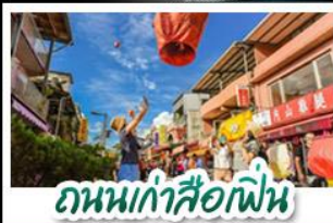
ถนหนเก่าลือเฟิ่น