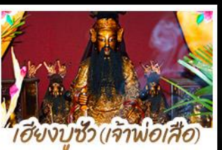
ไฉ่ซิงบูซู่ (เจ้าพ่อเสือ)