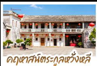
คฤหาสน์ตระกูลหวังเฉี