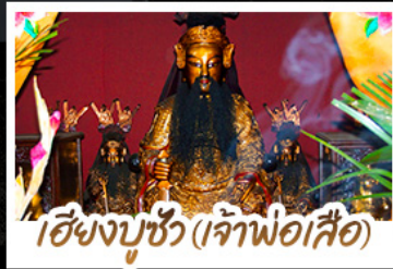
เซียงบูชัว (เจ้าพ่อเสือ)