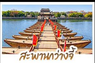
สะพานว้างจี