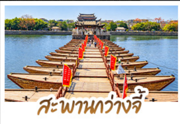
สะพานหวางจี