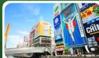
ช้อปปิ้งย่านชินโซบาชิ