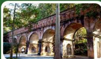
วัดนินเซ็นจิ