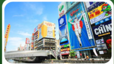
ช้อปปิ้งย่านชินโซบาชิ