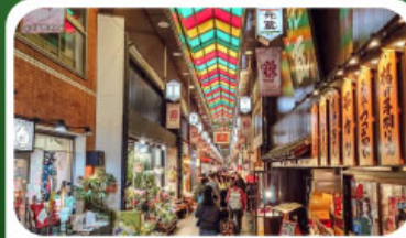
ตลาดปลานิชิกิ