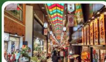
ตลาดปลาชิซึกิ