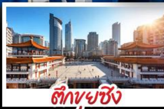
ตึกขุยซิ่ง