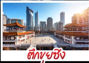
ตึกปูซิง