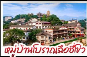
หมู่บ้านโบราณถื่อซื่อโจ้ว

พระแกะสลักหินตำจู้ - ตึกตะเกียบ Raffles City - ตึกขุยซิ่ง ทรดคอร์เบียร์ - หมู่บ้านโบราณถื่อซื่อโจ้ว