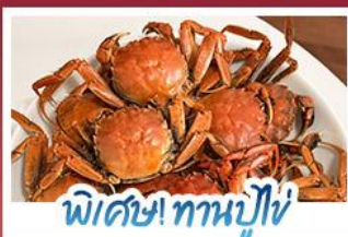
พิเศษ! ทานปูใหญ่

ปรากฏการณ์ธรรมชาติ 1 ปี มีแค่ครั้งเดียว! เตรียมชุดเก่งไปถ่ายรูปกับ 'หาดแดงผานจีน' ที่กำลังพรมสีแดงสดไปทั่วผืนน้ำ พร้อมฟินสุดขีดกับฤดูกาลทานปูที่คึกคักที่สุดแห่งปี • สัมผัสสวนนิลแห่งตะวันออกที่ต้าเหลียน