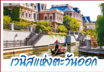
เวนิสแห่งตะวันออก