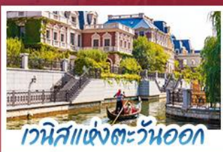
เวนิสแห่งตะวันออก