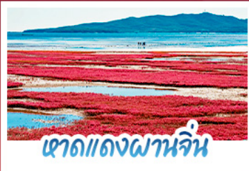
เขาดแดงผานจีน