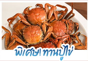
พิเศษ! ทานปูไข่

ปรากฏการณ์ธรรมชาติ 1 ปี มีแค่ครั้งเดียว! เตรียมชุดเก่งไปถ่ายรูปกับ 'หาดแดงผานจีน' ที่กำลังพรมสีแดงสดไปทั่วผืนน้ำ พร้อมฟินสุดขีดกับฤดูกาลทานปูไข่ที่ดีที่สุดแห่งปี • สัมผัสเวนิสแห่งตะวันออกที่ด้าหลิเยน