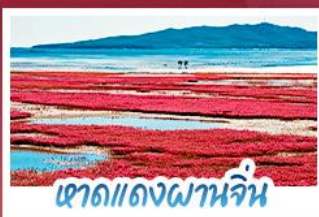
เขาดแดงผานจีน