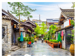
ชอยกวางชอยแคบ