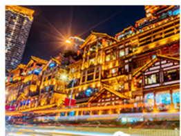
แสงเขาดัง

อุทยานหลุมฟ้าสะพานสวรรค์ • อุทยานเขานางฟ้า • หงหยาดัง • ตึกพูยง ชั้น 22 • วัดคำอ้อ ชมรถไฟกะสุติก • สะพานโบราณหนานเฉียว • เมืองโบราณกวางเจี้ยน • อุทยานภูเขาสีดรุณี อุทยานตำกูปิงชาน • จตุรัสหยางเทียนหวู่ • รูปปั้นหมีแพนด้าอนเซลฟี • ร้านหมิงฮงซิงซูเก้อ ถนนคนเดินซุนซีลู่ • หมีแพนด้าปิ่นตึก IFS • ถนนไม้กู่หลี่ • ถนนโบราณชอยกวางชอยแคบ