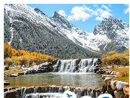
อุทยานปี่เฉิงโกว