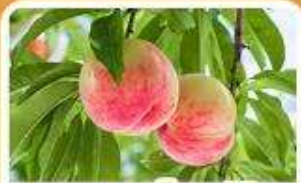
กิจกรรมเก็บผลไม้