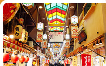
ตลาดปลาชิคิ