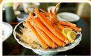
พิเศษ! ขาปู