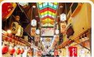
ตลาดปลา นิชิกิ