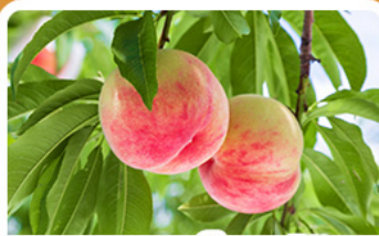
กิจกรรมเก็บผลไม้