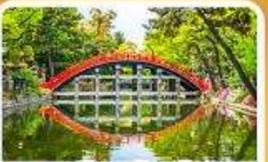
ศาลเจ้าซูมิโยชิ โทคะ