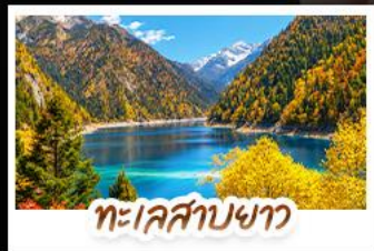
ทะเลสาบขาว