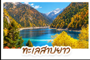
ทะเลสาบขาว