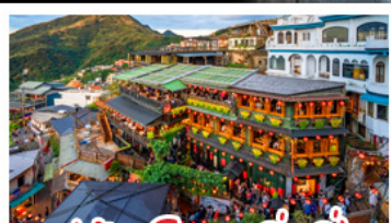
หมู่บ้านโบราณจีวเฟิน