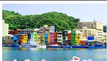
ทำเรือประมงเจิ้งปิ่น

รถไฟสายโบราณอาลีซาน - ตึกไทเป 101 ประมงเจิ้งปิ่น - จิวเฟิน - ล่องเรือทะเลสาบสุริยัมจินตรา ทานเมนูเด็ด เสี่ยวหลงเปา & ปลาประจานาธิบดี ช้อปปิ้ง 3 ย่านดัง : ซิเหมินดิง - ไถจงไนท์มาร์เก็ต - MITSUI OUTLET