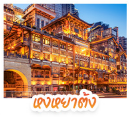
แดงเขยาดัง

สัมผัสใบไม้แดงสุดงดงามที่ ภูเขาเม่ีซางซาน และ ภูเขาทองอุ้ยซาน ชมวิวกลางคืนสุดอลังการที่ หงหยาดัง แลนด์มาร์กชื่อดังแห่งฉงชิ่ง สักการะพระโพธิสัตว์เจ้าแม่กวนอิม ณ วัดหลิงฉวน ขอพรเสริมสิริมงคล เช็กอินแลนด์มาร์กสุดฮิต แพนด้าปิ่นตึก IFS + POP MART ช้อปปิ้งจุใจที่ ไท่กุ่หลี่ ถนนคนเดินซุนชี่อู๋