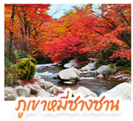
ภูเขาเม่ีซางซาน