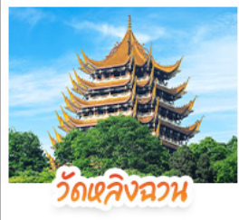
วัดเลิ่งฉวน