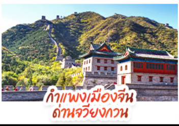
กำแพงเมืองจีน ถิ่นจิวยงกวน