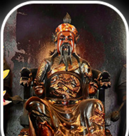
วัดปิกไค