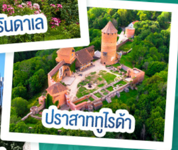
ปราสาททูลีดา