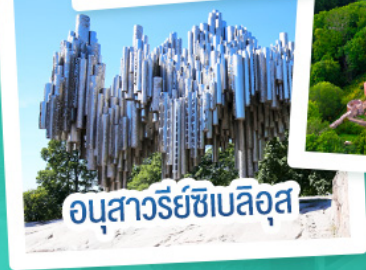
อนุสาวรีย์เซเบลึส