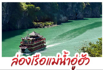
ล่องเรือแม่น้ำอู่ฮิว

ฉงชิ่ง - อุ๋หลง - เจียนเจียง หลุมฟ้าสามสะพานสวรรค์ - หงหยาดัง พุทธศิลป์ต้าจู้ - ล่องเรือแม่น้ำอู่ฮิว