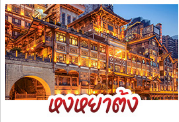
แดงเข่าตัง