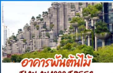
อาคารพันต้นไม้มือ TIAN AN 1000 TREES