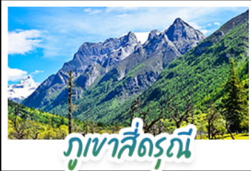
ภูเขาหิมะสุดตระการตา