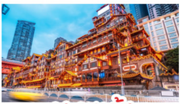
แสงเซยงต้ง

อุทยานหลุมบ่อฟ้า - อุทยานเทานางฟ้า หงหยาดัง - นังรถไฟทะเลตุ๊ก - อุทยานสี่ดรุณี ปี่ผิงโกว - สะพานหนานเฉียว