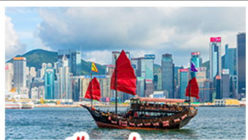
เมืองฮ่องกง

เมืองเก่าชิงเต่า - วิวเมืองฮ่องกง โรงเบียร์ชิงเต่า - ท่าเรือชาวประมงเยียนไถ