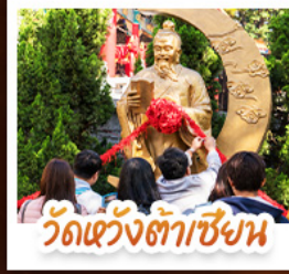
วัดเข่งต้าเซียน