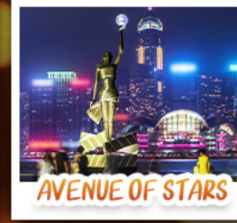
AVENUE OF STARS