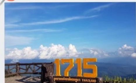
จุดชมวิวที่มีความสูง 1715