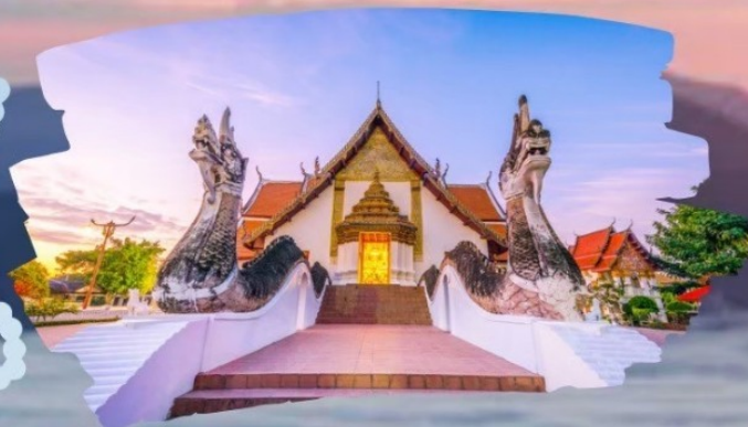
วัดกুমินทร์