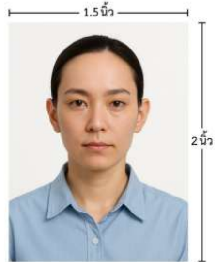
ขนาดรูปตัวอย่างใช้ยื่น Visa

*** ห้ามขีดเขียน แม็ก หรือใช้คลิปลวดหนีบกระดาษ ซึ่งอาจส่งผลให้รูปถ่ายชำรุด และไม่สามารถใช้งานได้ ***