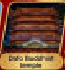
Dafo Buddha Temple