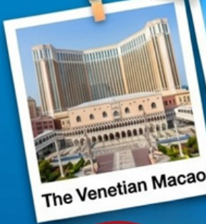
The Venetian Macao