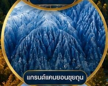
แกรนด์แคนยอนซูยกุน