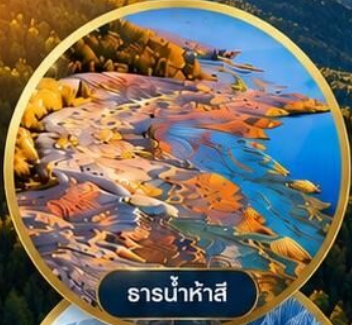
ธารน้ำห้ำสี