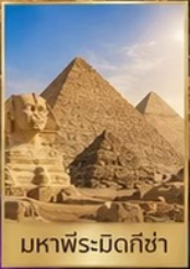
มหาพีระมิดกิซ่า