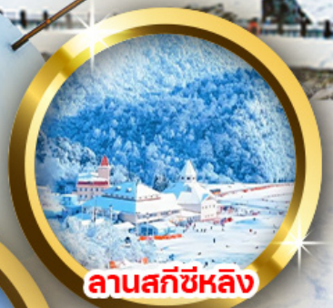
ลานสกีซีหลิง