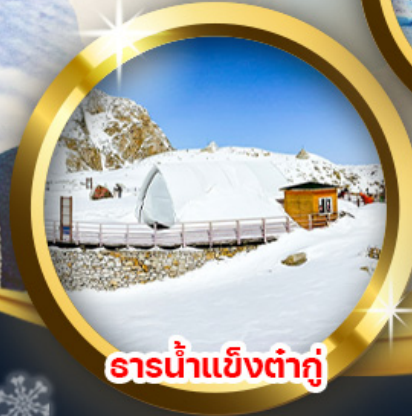
ธารน้ำแข็งต่ากู่