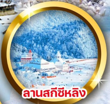
ลานสกีซีหลิง