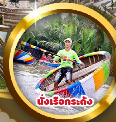
นั่งเรือกระดง