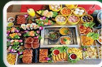
ปิ้งย่าง BBQ