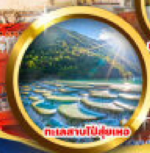
ทะเลสาบป๋ายู่เหมอ