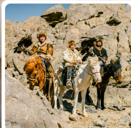
ชนเผ่ามองโกเลีย