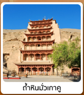
ต้าสินมั่วเกา

• โอโไฮ้...เส้นทางสายไหม ชมสระน้ำวงพระจันทร์ ทะเลทรายหมิงซาซาน กำแพงเมืองจีนด่านสุดท้าย "เจียหยวี่กวน" มรดกโลกภูเขาสายรุ้งจางเย่