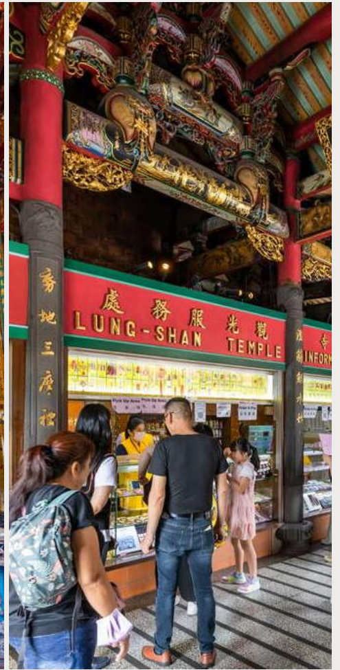
วัดหลงซาน (Longshan Temple)

กลางวัน บริการอาหารกลางวัน ณ ภัตตาคาร (เมนูพิเศษ บุฟเฟ่ต์ชาบู)