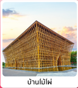
บ้านไม้ไฟ