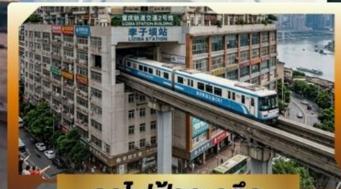
รถไฟฟ้ากะลุ่ก