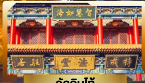
วัดจีนไท้