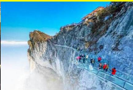
ระเบียงทางเดินกระจากเลียบบหน้าผา