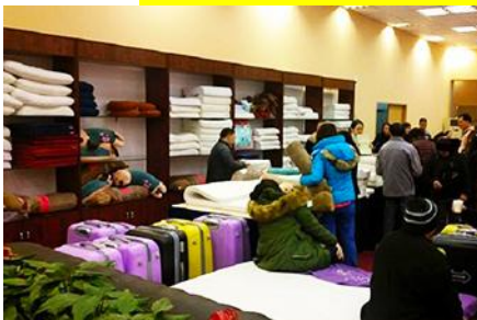
ศูนย์จำหน่ายผลิตภัณฑ์ยาวพารา