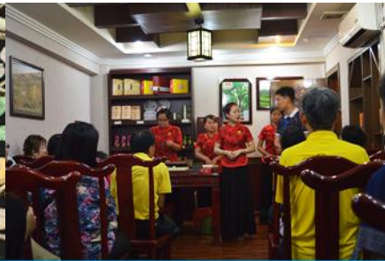
ร้านไบบา