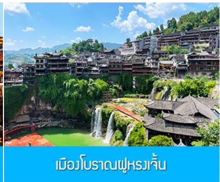
เมืองโบราณฝูหรงจิ้น