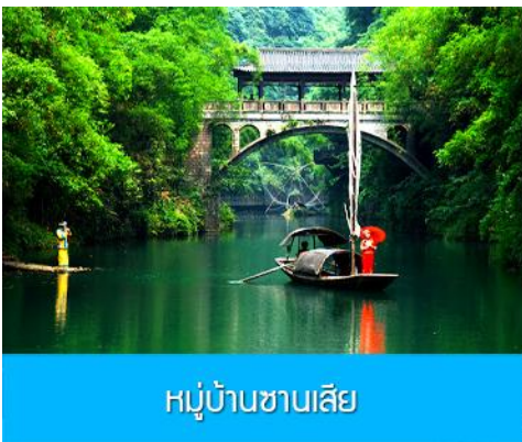
หมู่บ้านซาเลีย