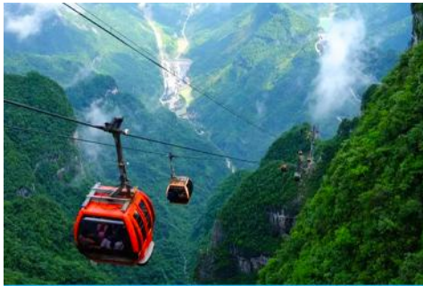
เขาเจ็ดดาว

รับประทานอาหารกลางวัน ณ ภัตตาคาร **บุฟเฟ่ต์หมูย่างเกาหลี (8)