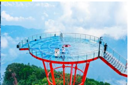
ระเบียงชมวิว Sky Eye