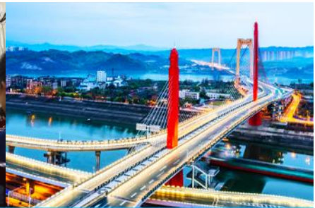
เมืองหยิซาง

วันที่ห้า เมืองจางเจี๋ย - เลือกซื้อโปรแกรมทัวร์เสริม OPTIONAL TOUR - ร้านหยก-ร้านไบบา-เมืองหยิซาง