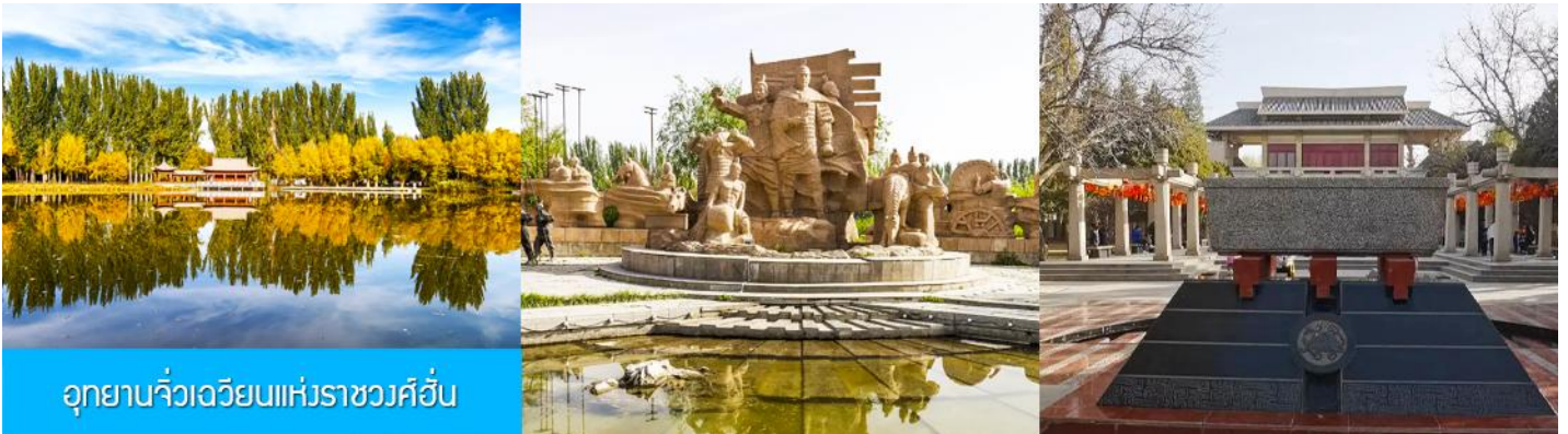
อุทยานจิวเจี๋ยนแห่งราชวงศ์ฮั่น

จากนั้นนำท่านเดินทางสู่เมืองจิวเจี๋ยน (ระยะทาง 50 กม. ใช้เวลาเดินทาง 1 ชั่วโมง)