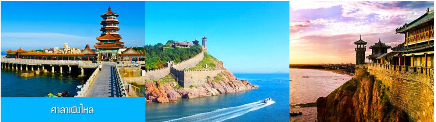
ศาลาแดงไหหล

รับประทานอาหารกลางวัน ณ ภัตตาคาร (มื้อที่ 3)