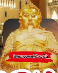
วัดแบกองค์ปัจจุบัน