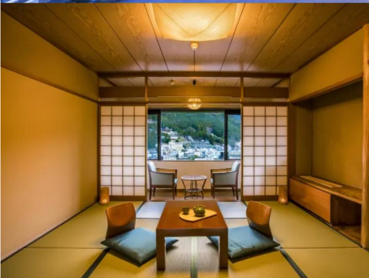
Standard Japanese-style Room 49.5m