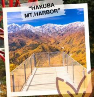
"HAKUBA MT. HARBOR"

วันเดินทาง 28 ต.ค. - 3 พ.ย. 2569 4 - 10, 11 - 17 พ.ย. 2569