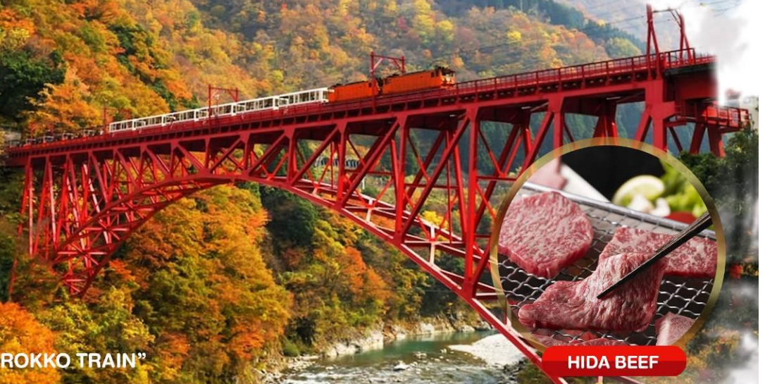
“KUROBE TOROKKO TRAIN”