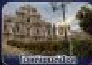
วิวทิวทัศน์