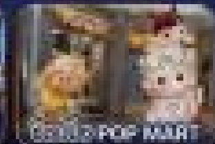
🎁 POP MART