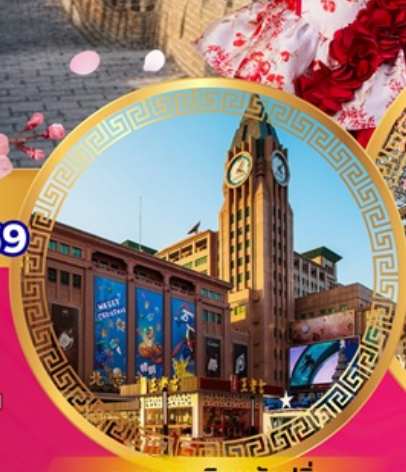
ถนนคนเดินหวังฝูจิ่ง

เที่ยวย่านการค้าดังกลางกรุงปักกิ่ง ถนนคนเดินหวังฝูจิ่ง จัตุรัสเทียนอันเหมิน พระราชวังกุ๊กกิง หอฟ้าเทียนถาน ช้อปปิ้งย่านซานหลี่ถุน พระราชวังฤดูร้อนอวิ๋เหอหยวน กำแพงเมืองจีนด่านอวิ๋หยงกวน ชมซากุระบาน สักการะวัดลามะ