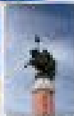
ชมเมืองโกลีเสียน (โกลีเสียน)