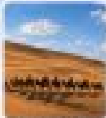
ชมเมืองโกลีเสียน (โกลีเสียน)