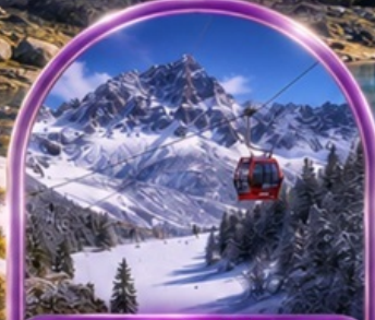
อุทยานต้ากู่ปิงชวน (รวมรถอุทยาน+กระเช้า)

พิเศษ สุขี่หม่าล่า !! พร้อมน้ำจิ้มรสเด็ด