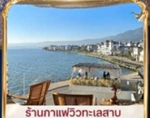
ร้านอาหารวิวทะเลสาบ BAN SHAN YUE (รวมค่าเช่า ไม่รวมเครื่องดื่ม และค่าเช่าเสื้อผ้ารูป)