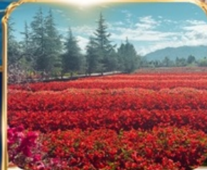
สวนดอกไม้ HUA YU MU CHANG