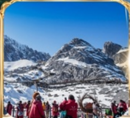
ภูเขาหิมะมังกรหยก +กระเช้าใหญ่