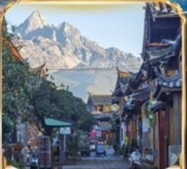
เมืองโบราณซูเหอ