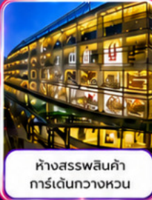
ห้างสรรพสินค้า การ์เด็นกวางหวน