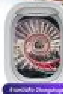
Hot Air Champagne